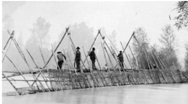
University of Washington

ការសម្អាតបរិស្ថាន និងការស្តារដែនជម្រកនៅតាមពាមនៅទីតាំងនេះត្រូវបានចូលគ្នាជាមួយទេសភាពបែបវប្បធម៌នៃទន្លេ Duwamish River។ ការស្តាររួមចំណែកដល់សុខភាព និងភាពធននៃទន្លេ និងរដូវផ្ការីកត្រីសាម៉ុង ដែលទ្រទ្រង់សហគមន៍ដែលពឹងផ្អែកលើវា។